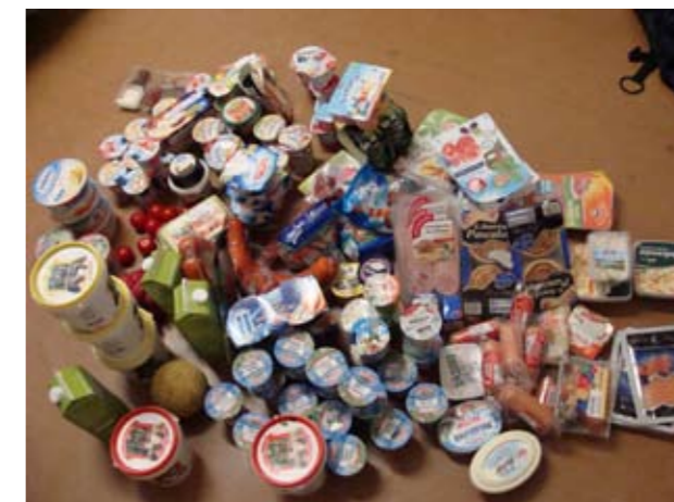
Ausbeute eines Abends

Wenn etwas nicht mehr ganz so gut aussieht, dann frage ich mich immer: „Wenn ich das gekauft hätte und es wäre bei mir zu Hause so schlecht geworden, würde ich es dann trotzdem noch verarbeiten?“ Wenn ja, nehme ich es mit, wenn ich es auch zu Hause in den Müll geworfen hätte, lasse ich es da.