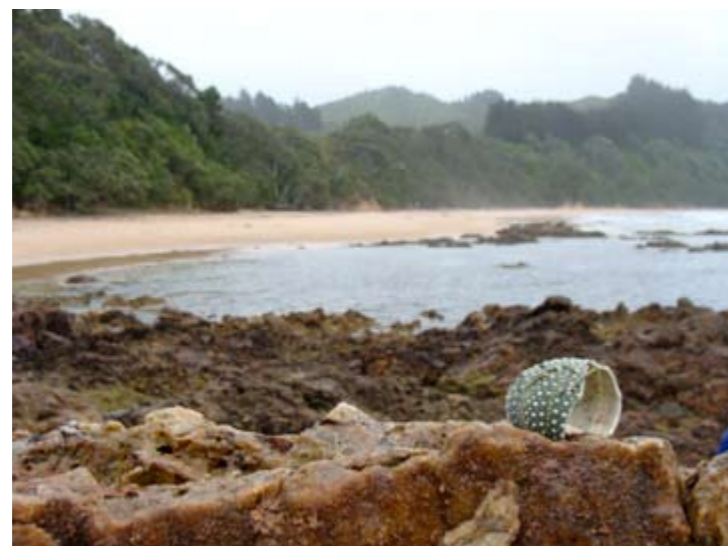
Coromandel Peninsula, Neuseeland

Freundliche Gastgeber sind entzückt erzählen zu können, sie waren schon mal in Munich, natürlich auf dem "Beerfest.". Weg gehen ist toll, genauso wie wieder kommen (obwohl die Freude nur von begrenzter Dauer ist, nachdem man sich 2 Wochen –absolutes Maximum– den grauen Berliner Himmel angetan hat oder die antarktische Spree).