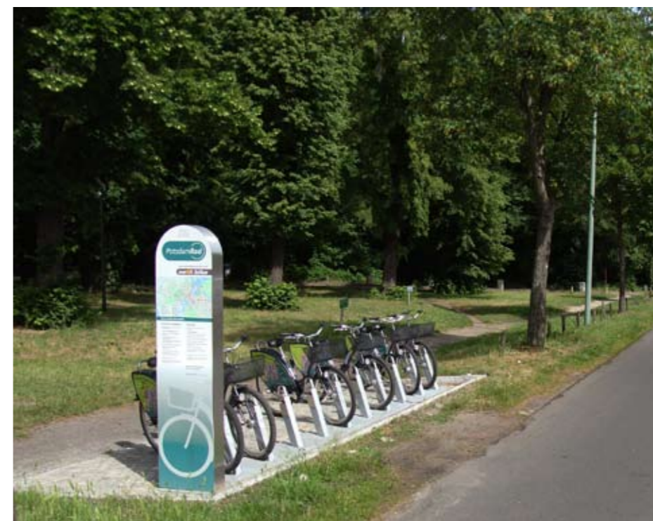
Nextbike-Ständer Am Neuen Palais, Bushaltestelle Campus Universität / Lindenallee

reichen Baustellen gefördert wird. Dann endlich komme ich auch zum besten Teil der Strecke: dem Park Sanssouci. Um ihn zu erreichen fahre ich einfach gerade aus durch die Feuerbach- und Lennéstraße, leider über viel Kopfsteinpflaster. Im Park scheint dann alles ruhiger und entspannter zu werden. Keine Autos und kein Lärm.